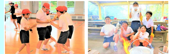
【チームワークゲーム】 【野外炊飯(カレーづくり)】

今回は霧島自然ふれあいセンターで1泊2日の活動でした。チームワークゲームや野外炊飯等の体験活動に取り組み、子どもたちは目標に向かって力を合わせる楽しさや喜びを味わうことができました。また、学校では見られない友達の新しい一面を発見することができ、さらに学級の絆を強くすることができました。