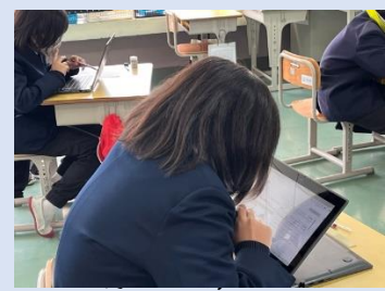
学力学習状況調査 (5・6年)

まだまだこれから成長していく子どもたち。自分なりの正しさを築き上げていくことも大事なことです。その一方で、その正しさにとらわれすぎることなく、安心してベータ版を更新していくたくましさやしなやかさ、やさしさをもち続けて欲しい…と思うのは、わたしのイメージする「完成形」でしょうか。